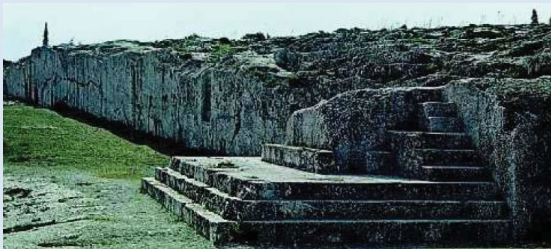
Πνύκα : Χώρος συνεδριάσεων της Εκκλησίας του Δήμου

Την φράση : «εν σοι, νυν, Καλλίμαχε, εστί...» , (από εσένα, τώρα, Καλλίμαχε, εξαρτάται...), απηύθυνε ο Στρατηγός Μιλτιάδης , πριν την μάχη του Μαραθώνα, προς τον Πολέμαρχο Καλλίμαχο όταν επισήμως και με τρόπο δημοκρατικό τον επισκέφθηκε στην γενέτειρά του, τις Αφίδνες Αττικής, προκειμένου να τον πείσει όπως δώσει θετική ( την ενδέκατη) ψήφο προς το διχασμένο «Συμβούλιο των Στρατηγών» , ώστε να σχηματισθεί η απαιτούμενη πλειοψηφία για την λήψη απόφασης προς άμεση διεξαγωγή της μάχης των Αθηναίων κατά των Περσών στο πεδίο του Μαραθώνα και αποφυγή εγκατάλειψης του αγώνα, όπως πρότειναν τα μισά μέλη του Συμβουλίου, με την δικαιολογία ότι αυτός θα ήταν μάταιος και οδυνηρός εναντίον της τότε πανίσχυρης περσικής αυτοκρατορίας.