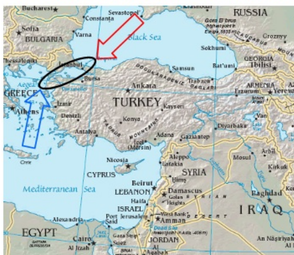
ΧΑΡΤΗΣ 1 ΣΤΕΝΑ ΔΑΡΔΑΝΕΛΙΩΝ-ΒΟΣΠΟΡΟΥ

Η Τουρκία όπως και η Ελλάδα, έγιναν δεκτές στο ΝΑΤΟ, την ίδια ημέρα και το ίδιο έτος, στις 18 Φεβρουαρίου του 1952. Ο λόγος προφανής: και οι δυο χώρες μαζί, έκλειναν την κάθοδο της τότε ΕΣΣΔ προς την Μεσόγειο. Και οι δυο χώρες ήταν απαραίτητες για την συγκράτηση της ΕΣΣΔ στον ηπειρωτικό χώρο της Ευρασίας. Σ' αυτήν την απόφαση του ΝΑΤΟ, ρόλο έπαιξε καθαρά η χρησιμότητα του εδάφους των δυο κρατών και ο έλεγχος που ασκούσαν στα Στενά (Δαρδανελίων-Βοσπόρου), στα νησιά του Αιγαίου και το Αιγαίο. Πλέον αυτού, η Τουρκία έχοντας απ' ευθείας χερσαία σύνορα με την ΕΣΣΔ, λειτουργούσε και ως ανάχωμα σε πιθανή προέλαση του σοβιετικού στρατού προς τον νότο. (Βλέπε Χάρτη 1, Στενά Δαρδανελίων-Βοσπόρου)